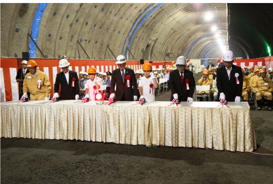
▲ご来賓の方々と唐丹小学校児童による貫通発破