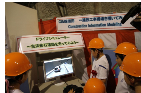
▲唐丹小学校児童による「ドライブシミュレーター」体験