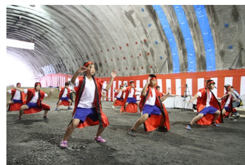
▲唐丹小学校児童による「唐丹よさこいソーラン」