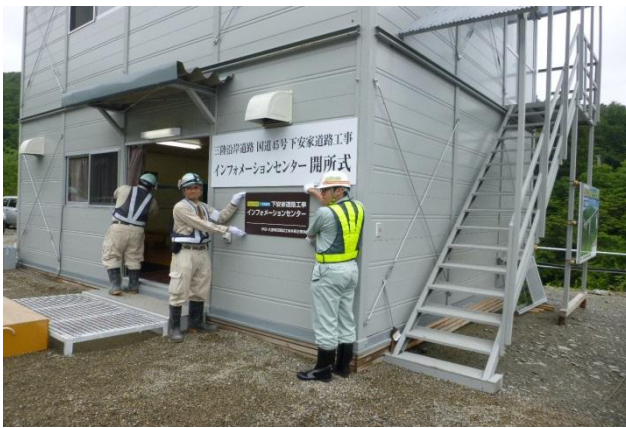
▲インフォメーションセンター開所式の看板設置