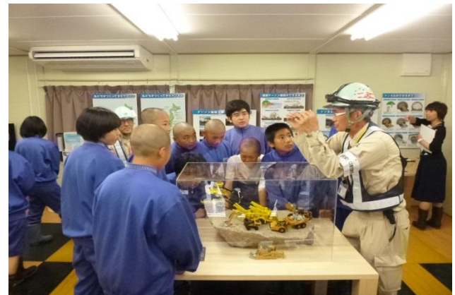
▲工事担当者の説明を受けながらセンター内を見学▲