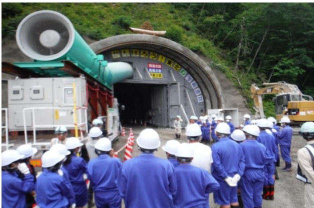
▲掘削工事中のトンネル工事現場を見学