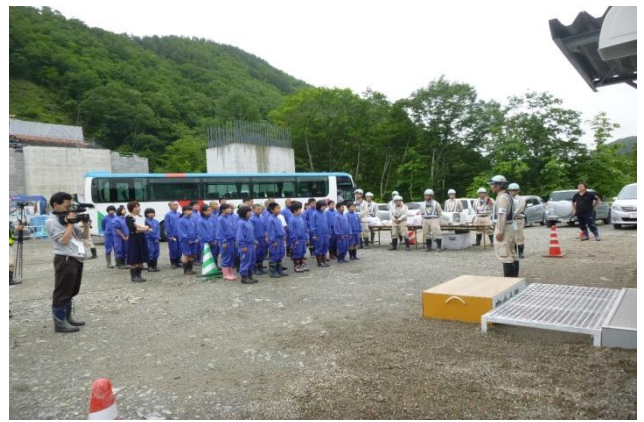
▲最初の来訪者、野田中学校の生徒さんに施設の説明