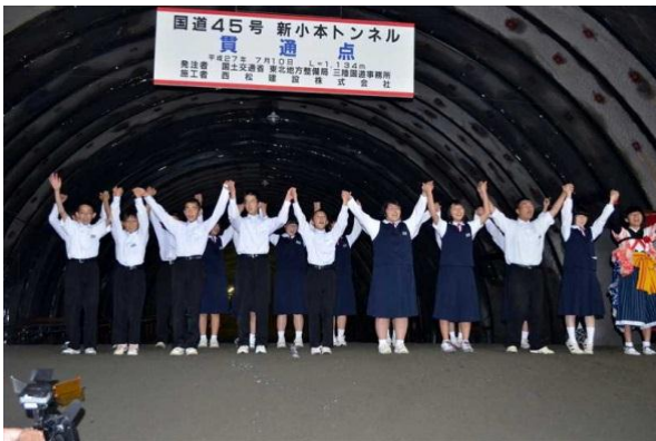
▲小本中学校生徒による通り初め