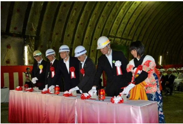
▲新小本トンネル貫通発破