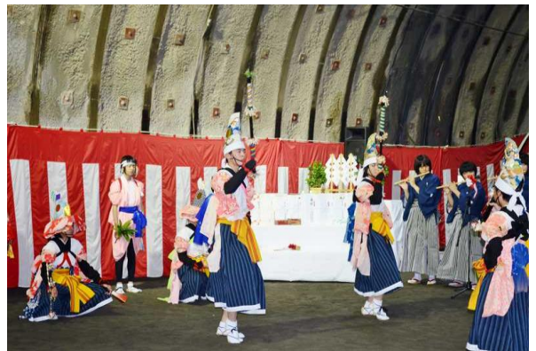
▲小本小学校生徒による中野七頭舞