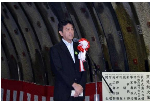
▲三陸国道事務所長挨拶