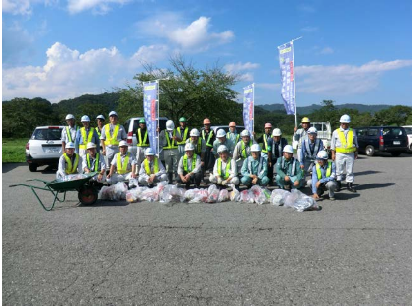
平成26年度 宮古箱石道路安全協議会 清掃活動実施状況