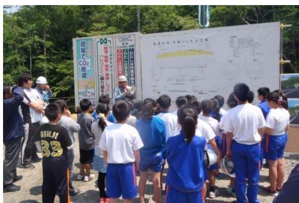
▲トンネルについて学習