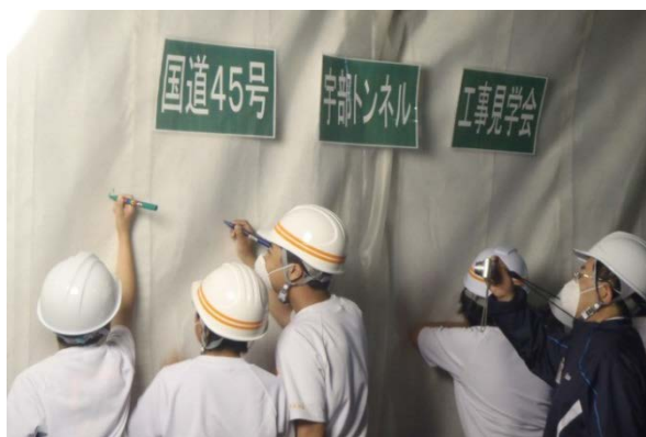
▲トンネルにメッセージを残していただきました