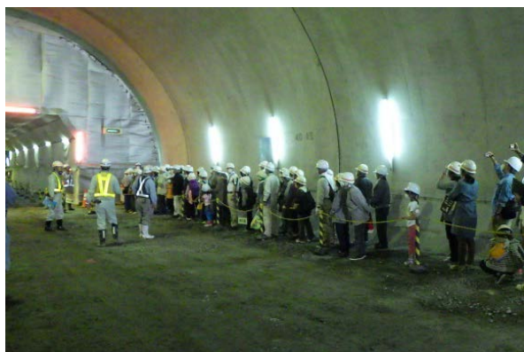
▲トンネルの中を見学 (宇部地区の皆さま)