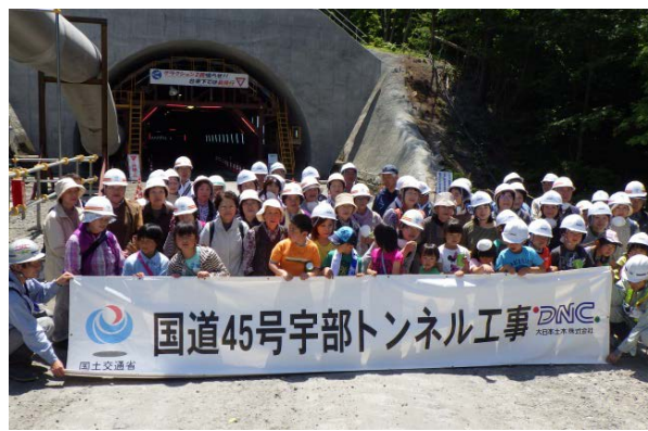
▲宇部トンネル北側坑口で記念撮影 (宇部地区の皆さま)