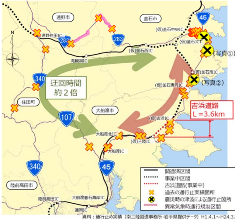
▼写真①（釜石市平田地区）