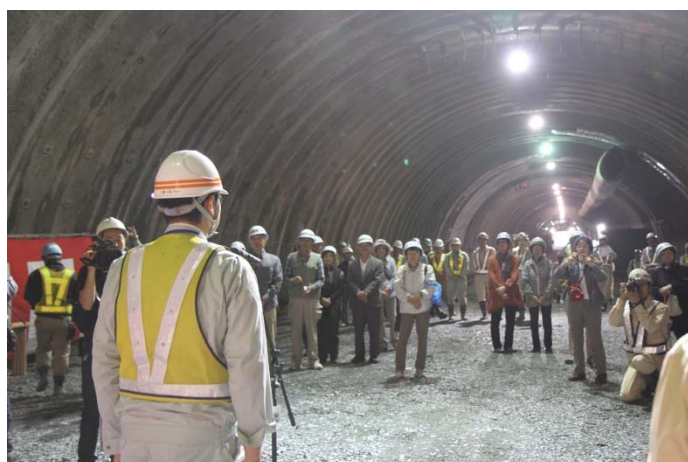
▲大菅監督官からの貫通報告