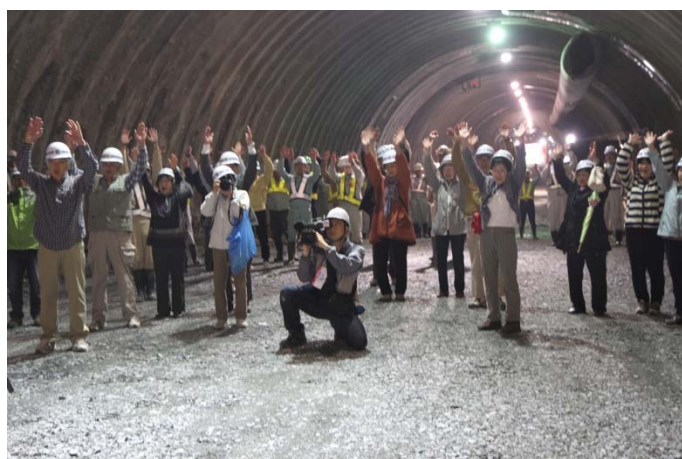
▲出席者全員による貫通を祝う万歳三唱