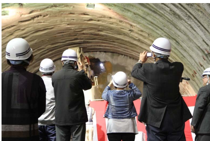
▲貫通の瞬間 一斉にシャッターを切る出席者の皆様

開催場所：岩手県上閉伊郡大槌町小鍬第23地割地内(小鍬第1トンネル 終点側坑口)