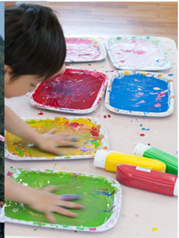
豊間根保育園の年長組による絵付け鯉のぼりも登場予定

※橋の両側に約5mのポールが約34本立ち、合計約100匹の鯉のぼりが泳ぐ予定です。