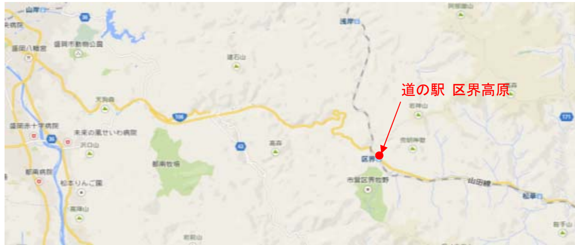
道の駅 構内 配置図 …… 集合場所