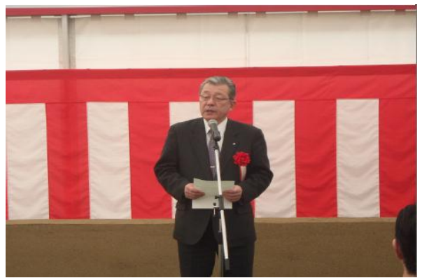
▲野田村長より来賓祝辞を頂きました