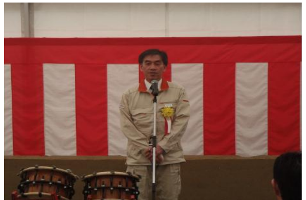
▲施工者謝辞（戸田建設（株））