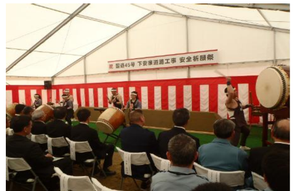
▲なもみ太鼓の皆さんが「なもみ太鼓」で激励してくださりました