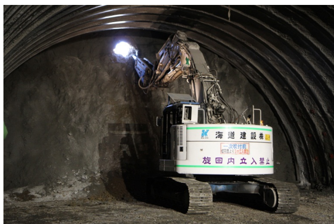
▲貫通の瞬間の状況