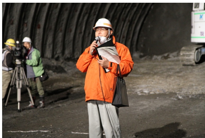
▲発注者挨拶(南三陸国道事務所副所長)

開催場所：上閉伊郡大槌町大槌第23地割地内(沢山地区) (大槌第1トンネル 起点側坑内)