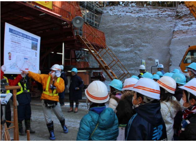
▲三陸沿岸道路の概要や整備効果を説明