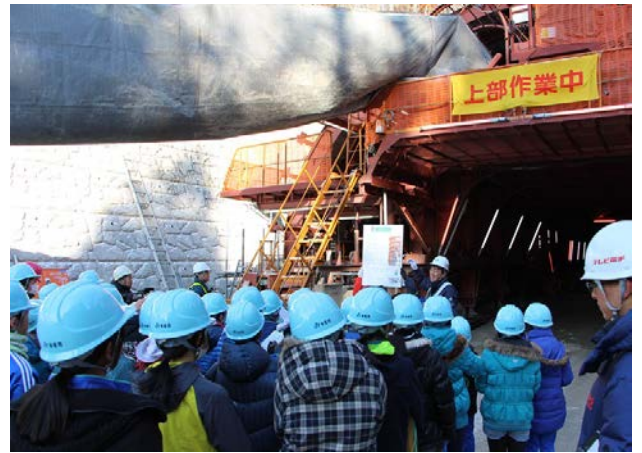
▲トンネルの掘削方法などについて説明