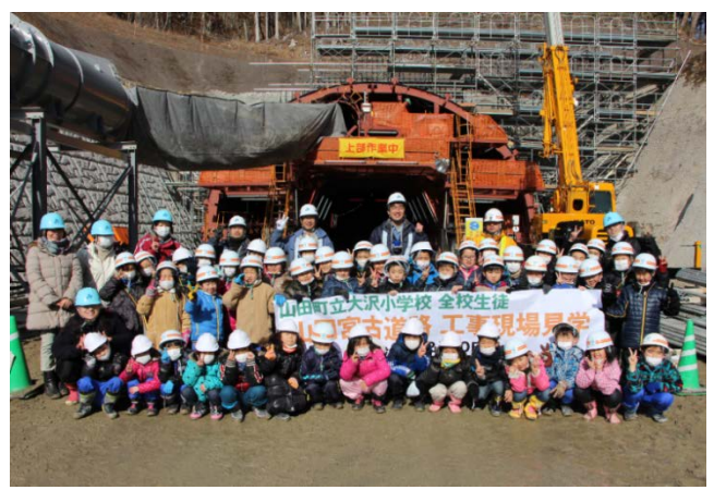
▲（仮称）山田第2トンネル坑口前で記念撮影