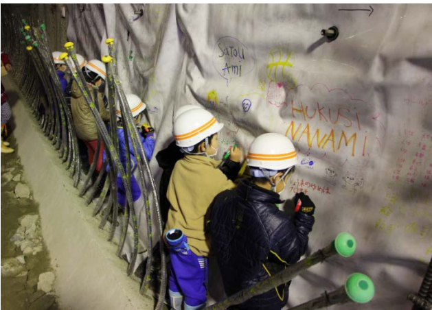
▲トンネル内部の防水シートへ将来への夢やメッセージを書き込んでいます