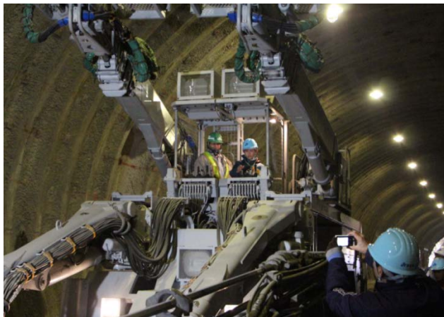
▲大型機械に乗り込んで操作体験