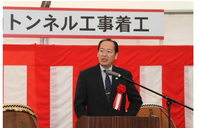
▲祝辞(陸前高田市長)