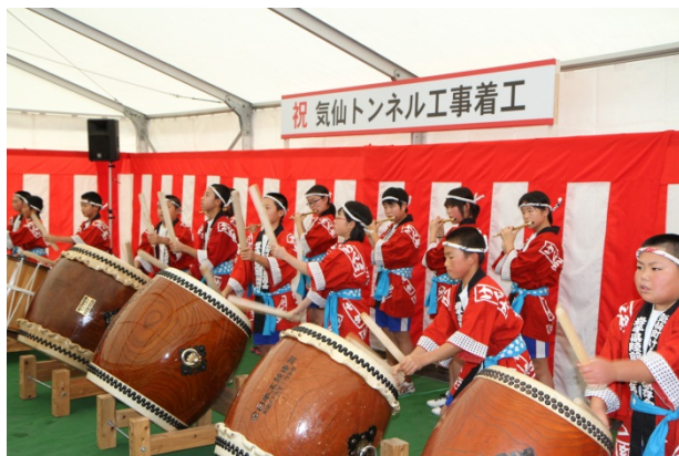
▲気仙町けんか七夕太鼓