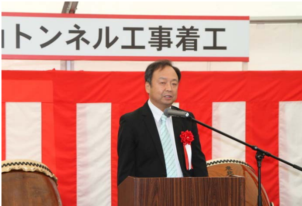
▲発注者挨拶(南三陸国道事務所長)