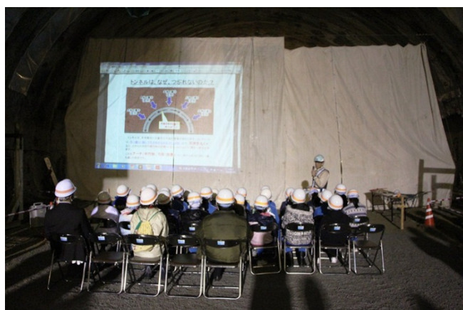
▲トンネルの構造等について簡単に説明