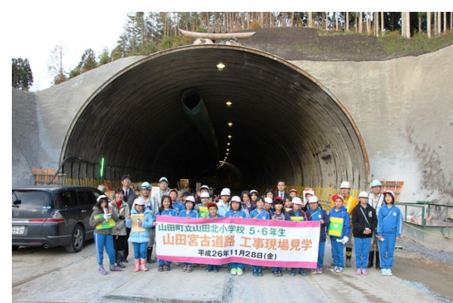
▲最後にトンネル坑口前で記念撮影