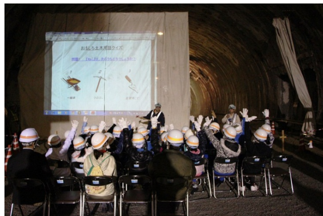
▲土木用語のクイズコーナーも行いました