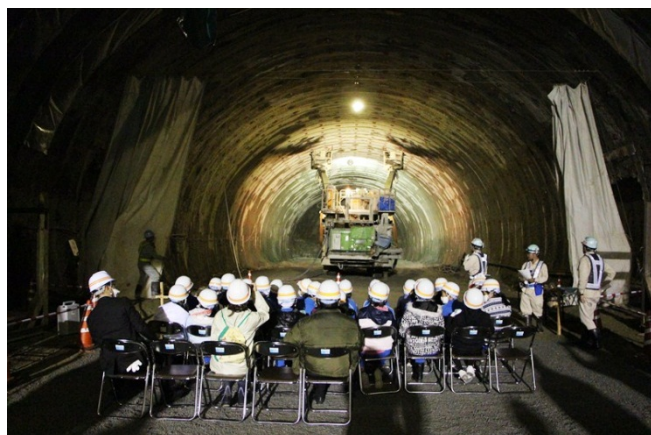
▲トンネルを掘るときに使う重機が登場