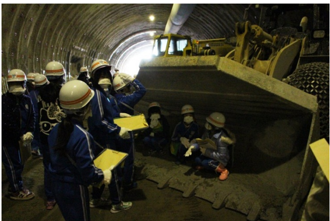
▲ホイールローダの大きさを実感