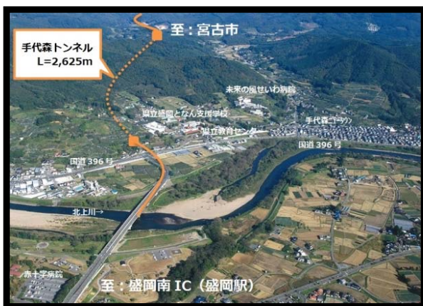
▲①手代森トンネル予定地

当日は、宮古盛岡横断道路安全協議会連絡会により、手代森トンネル宮古側坑口から天狗森バス停までの約1.5kmにわたって約30名が参加して清掃活動も実施されました。