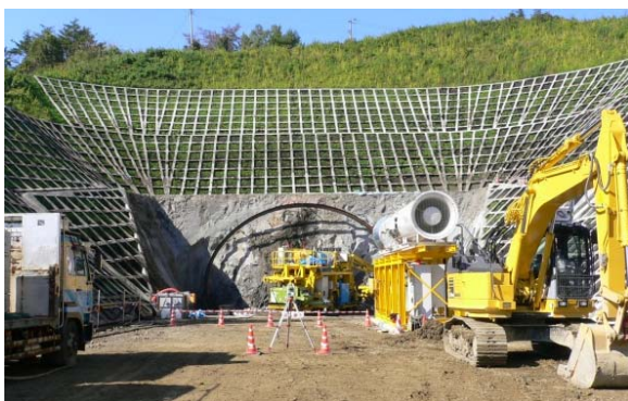
▲②手代森トンネル坑口(宮古側)

手代森トンネルは、復興支援道路 宮古盛岡横断道路の一部を構成している都南川目道路(延長6km)の一部で、盛岡市街地や東北縦貫自動車道のインターチェンジ等へのアクセスの向上、物流の円滑化等が期待されています。