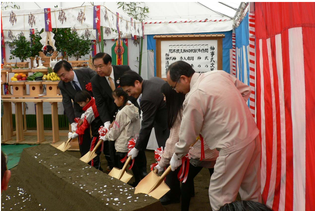
▲鍬入れの義に参加する盛岡市長と川目小学校の児童ら

11月1日(土)、盛岡川目地内において手代森(てしろもり)トンネル工事の安全祈願祭が実施されました。神事では岩手県盛岡広域振興局長、盛岡市長、地元の市立川目小学校の児童等による「鍬入れの儀」や「玉串奉奠」等を行い、被災地の1日も早い復興と工事の安全を祈願しました。これから手代森トンネルは本格的な掘削工事に入ります。