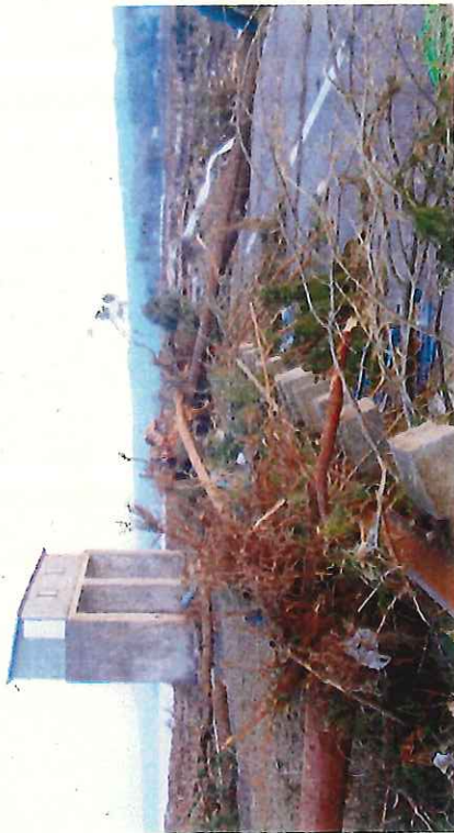
写真② 岩泉町小本地区