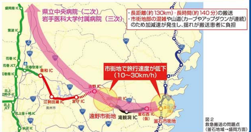
図2 救急搬送の問題点(釜石地域→盛岡方面)