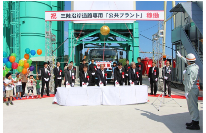
▲火入の儀、くす玉開披及び風船上げ