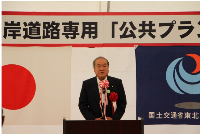
▲来賓祝辞（衆議院議員 鈴木 俊一）