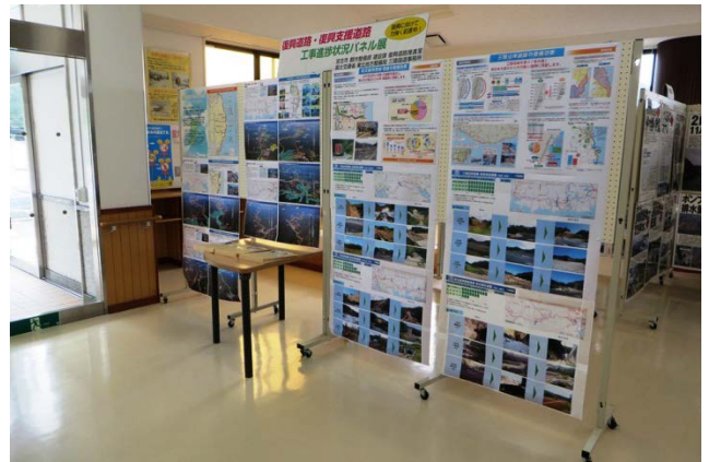
▲道の駅たろう たろう津波防災道路情報館 展示状況