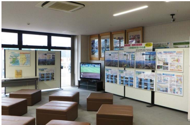
▲道の駅みやこ展示状況