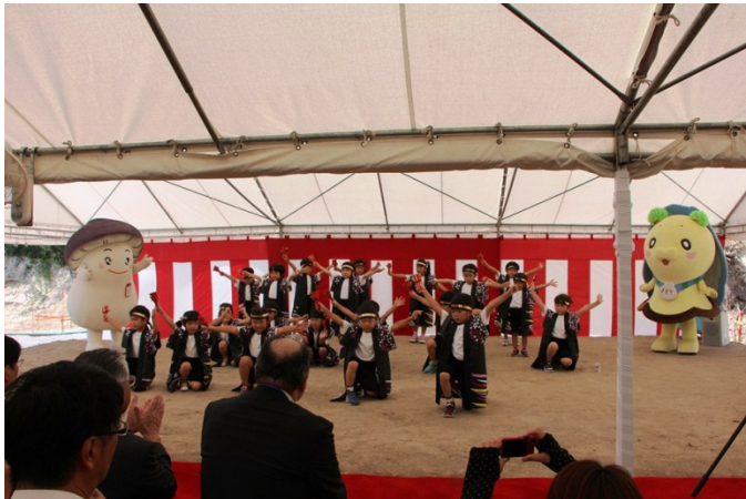
▲よさこいソーラン(豊間根保育園児)