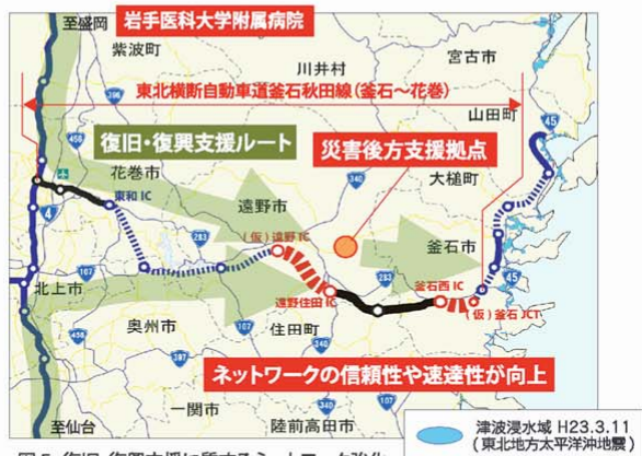
図5 復旧・復興支援に資するネットワーク強化

「救助・救援活動の支援」「緊急物資輸送の確保」「周辺市町村との連携強化」が図られます。