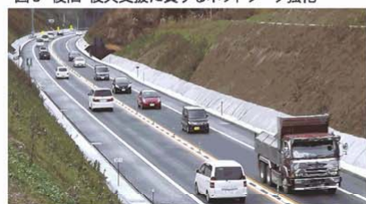
図6 部分供用区間 (遠野市～花巻市) の状況

◎沿岸部と災害後方支援拠点の内陸部を結ぶ横断軸が強化され、釜石市～遠野市～花巻市間における連絡時間が短縮されます。