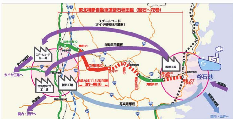
図2 物流拠点との交流・連携

◎工業団地等が集積する内陸部と、港湾運送の拠点である釜石港との交流・連携を強化することで、物資輸送など物流の効率化を図り、産業の振興を支援します。(図2)