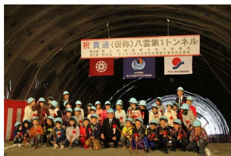
▲双葉小全員での通り初め