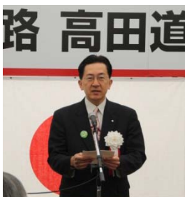
▲あいさつ (岩手県知事)