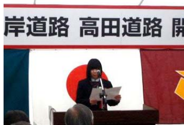
◀岩手県立高田高等学校生徒による高田道路開通への思い発表