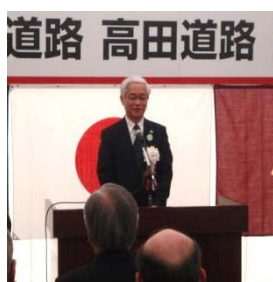
▲あいさつ (国土交通省道路局長)