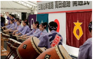
▲岩手県立大船渡東高等学校太鼓部の演奏