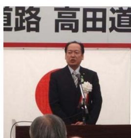
▲あいさつ (陸前高田市長)