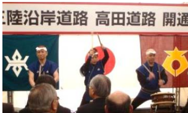
▲陸前高田市 氷上太鼓の演奏