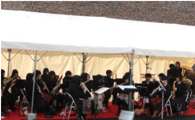
▲岩手県立高田高等学校吹奏楽部の演奏