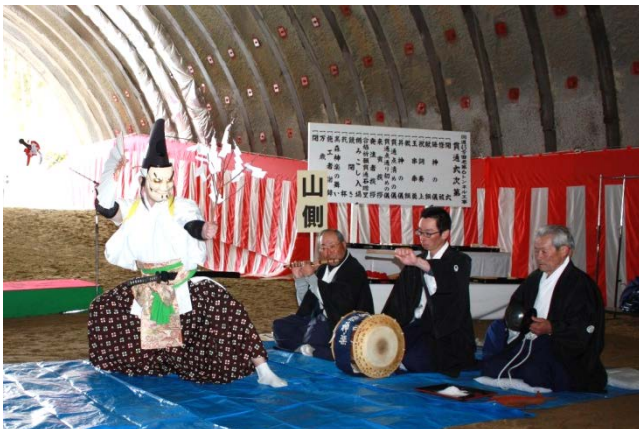
▲貫通を祝う黒森神楽の舞い