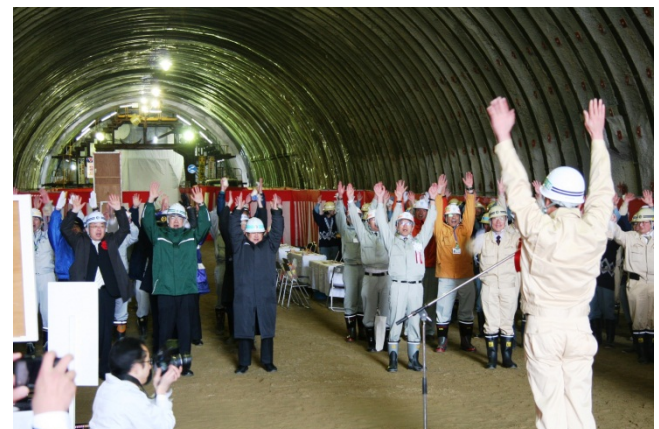
▲出席者一同による万歳三唱