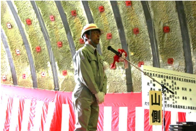
▲三陸国道事務所長の挨拶