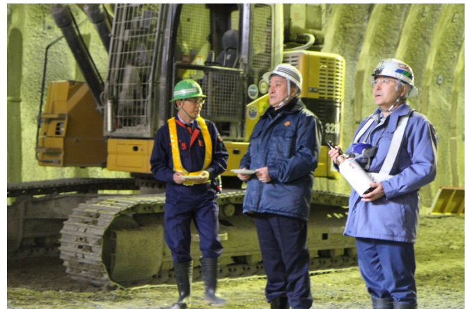
▲釜石市長による御清