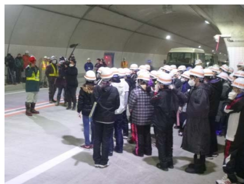
▲三陸国道事務所 岩淵建設監督官がトンネルの概要や作業について説明