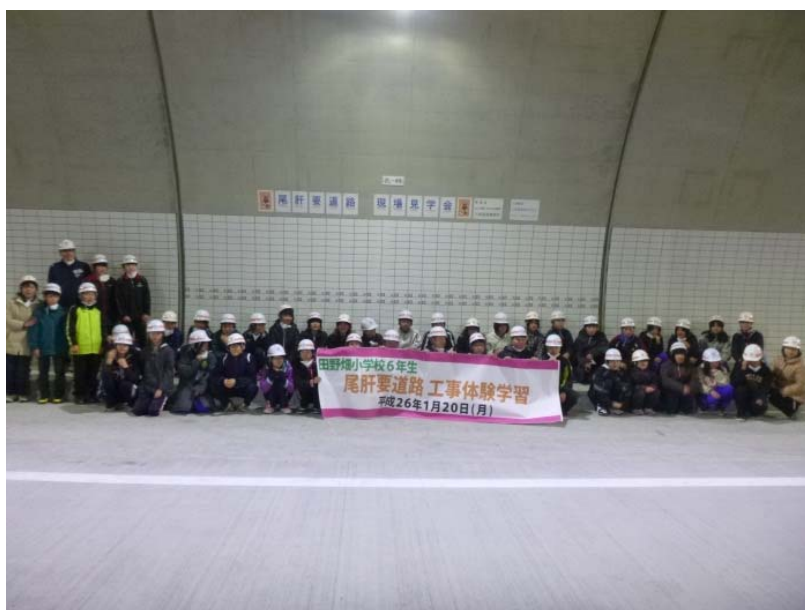
▲みんなで記念撮影 お疲れ様でした！どうもありがとう！