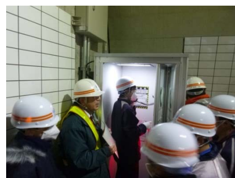
▲非常用電話の通話を体験 警察・消防への連絡方法を学びました