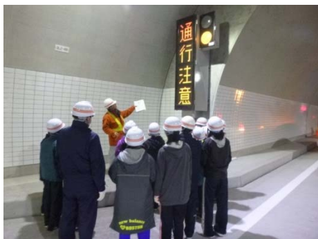
▲トンネル内情報板について説明