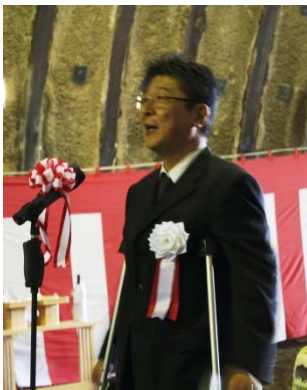
▲岩手河川国道事務所長の挨拶