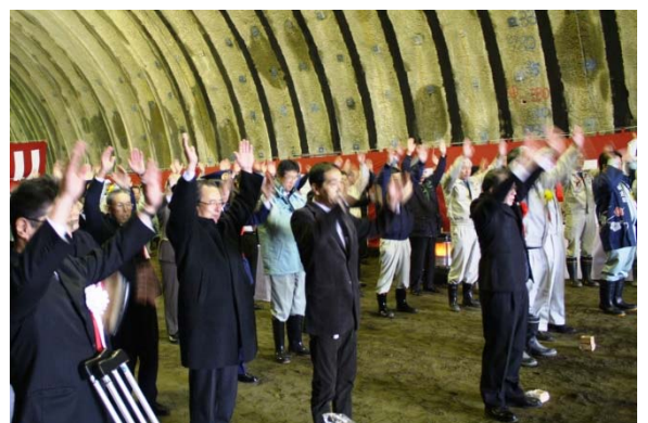
▲関係者全員による万歳三唱