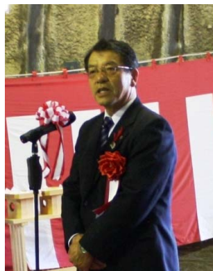
▲岩手県盛岡広域振興局長(代理)の挨拶