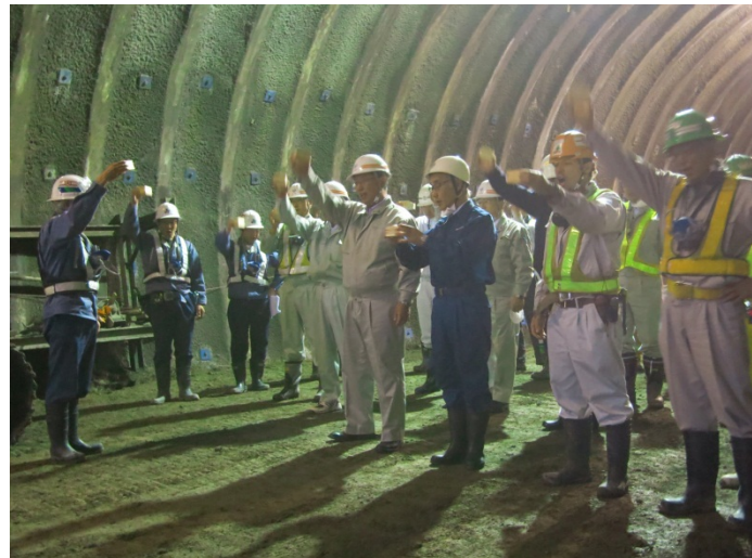
▲施工業者代表による万歳三唱