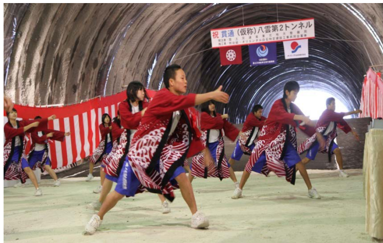
▲釜石市立釜石中学校の生徒による「釜中ソーラン」