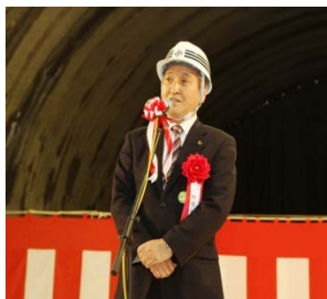
▲釜石市長による祝辞