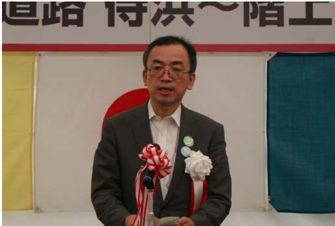
▲東北地方整備局道路部長の挨拶