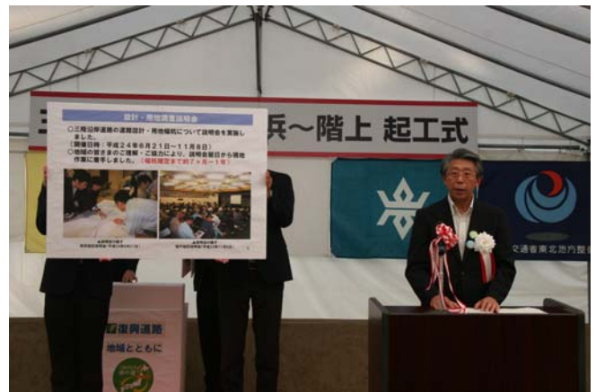
▲三陸国道事務所長による事業経過報告