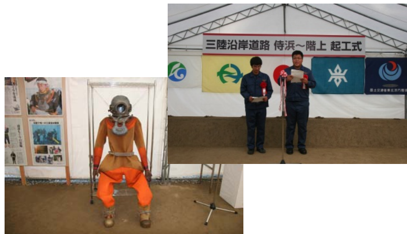
▲岩手県立種市高等学校のお二人より メッセージと南部もぐりの紹介展示