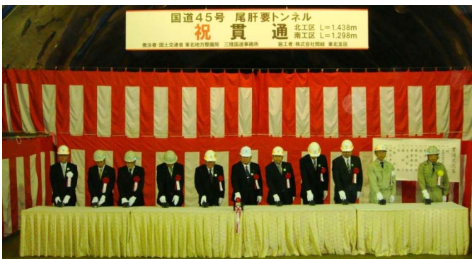
▲尾肝要トンネル貫通発破