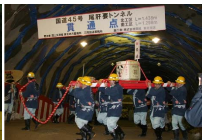
▲施工業者による樽御輿