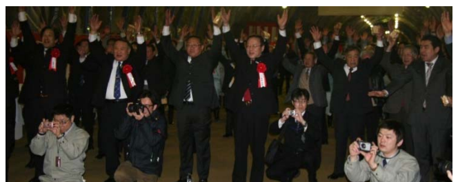
▲出席者全員による万歳三唱