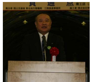
▲田野畑村上机村長挨拶