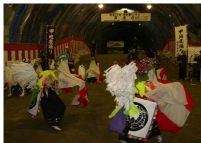
▲アトラクション「甲地鹿踊」