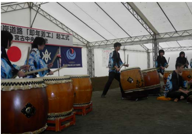
▲宮古水産高校による太鼓演奏