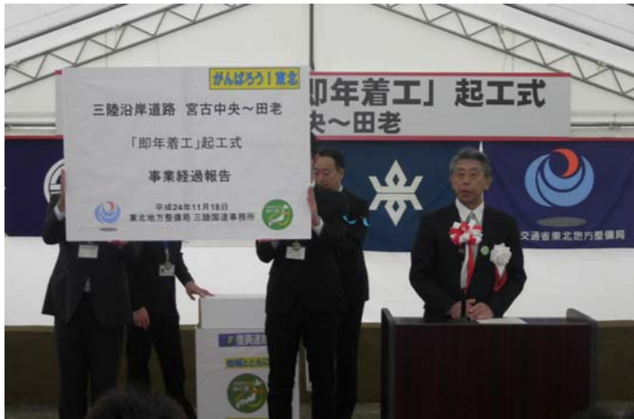
▲三陸国道事務所長による事業経過報告