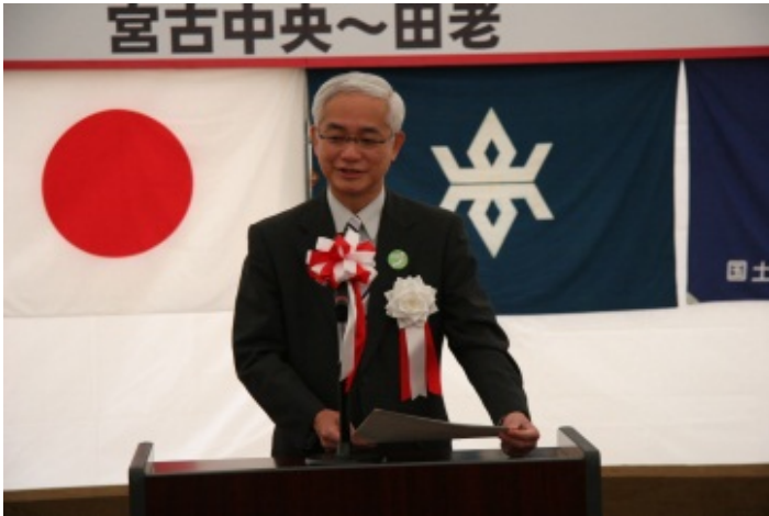
▲東北地方整備局長の挨拶