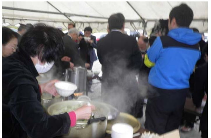
▲「明日を拓く宮古の道女性の会」から「秋刀魚のすりみ汁」のお振る舞い