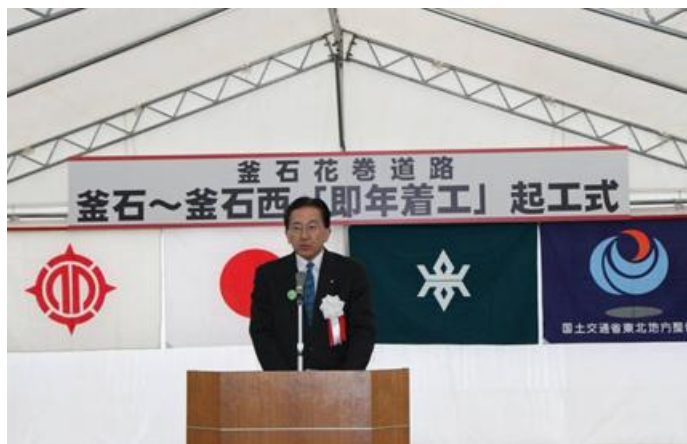
▲ 岩手県知事の挨拶

出席者：岩手県知事、釜石市長、復興副大臣、岩手県議会・釜石市議会議長、復興庁岩手復興局長、岩手県沿岸広域振興局長、東北地方整備局長、釜石商工会議所会頭、地域代表他