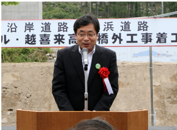
▲ 整備局道路部長の挨拶