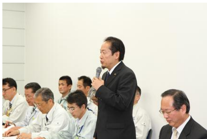
▲ 陸前高田市長の挨拶

対象区間：三陸沿岸道路（唐桑北～陸前高田）のうち、宮城県境～陸前高田 I C までの区間