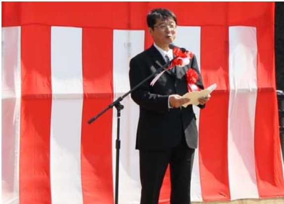
▲岩手河川国道事務所長の挨拶