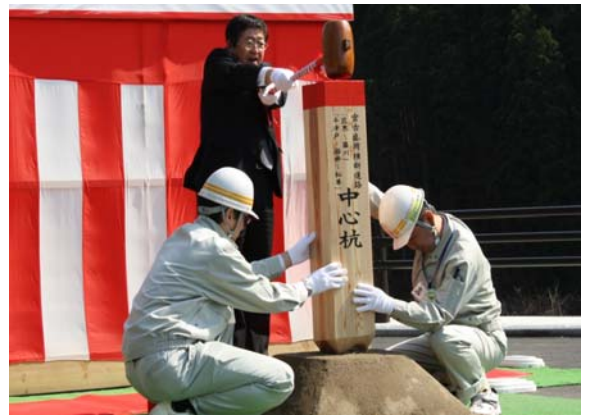
▲宮古市長による中心杭打設