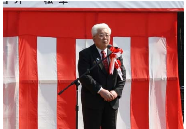
▲岩手県盛岡広域振興局長の挨拶