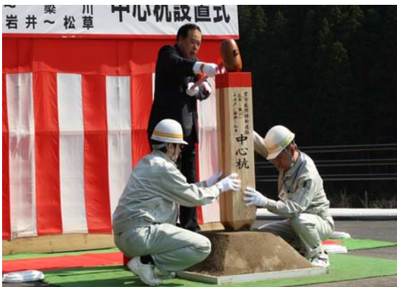
▲盛岡市長による中心杭打設