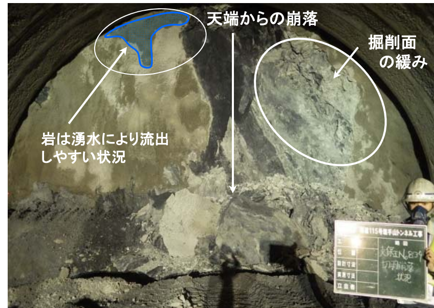
▲天端からの崩落及び掘削面の緩みの状況