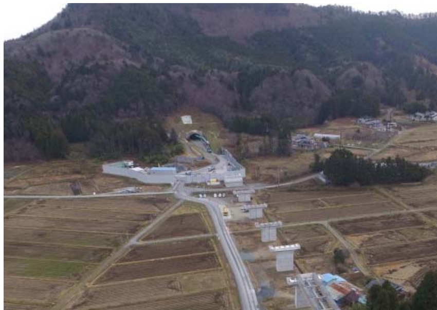
▲福島方面から塩手山トンネル坑口を望む