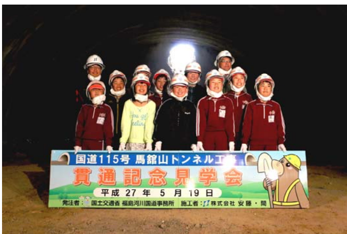
▲小国小学校集合写真