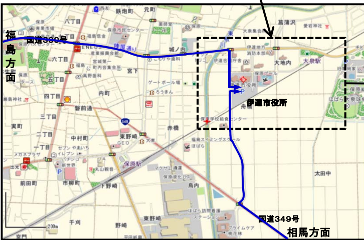
自家用車をご利用の方