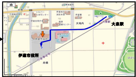
阿武隈急行をご利用の方

〈伊達市役所への案内〉 ・福島市方面からは、東北自動車道 福島飯坂ICより 県道387号・国道4号・国道399号にて約20分 ・相馬市方面からは、国道115号と国道349号交差点から、国道349号を北上し約10分