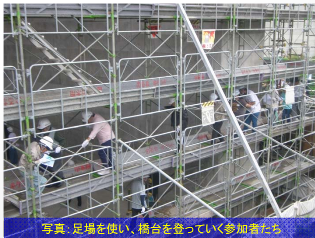
写真：足場を使い、橋台を登っていく参加者たち