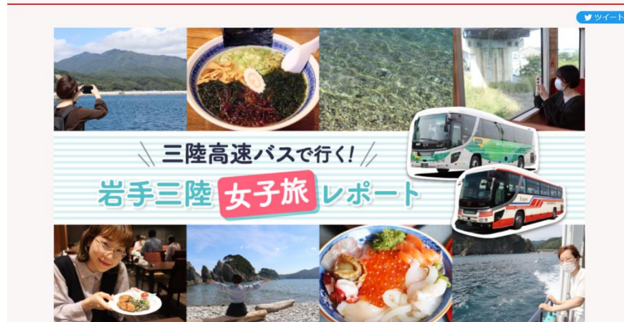
三陸高速バスで行く！岩手三陸女子旅レポート

制作：(株)ユーメディア/せんだいタウン情報machico編集部 ※2022年10月14日時点での情報です