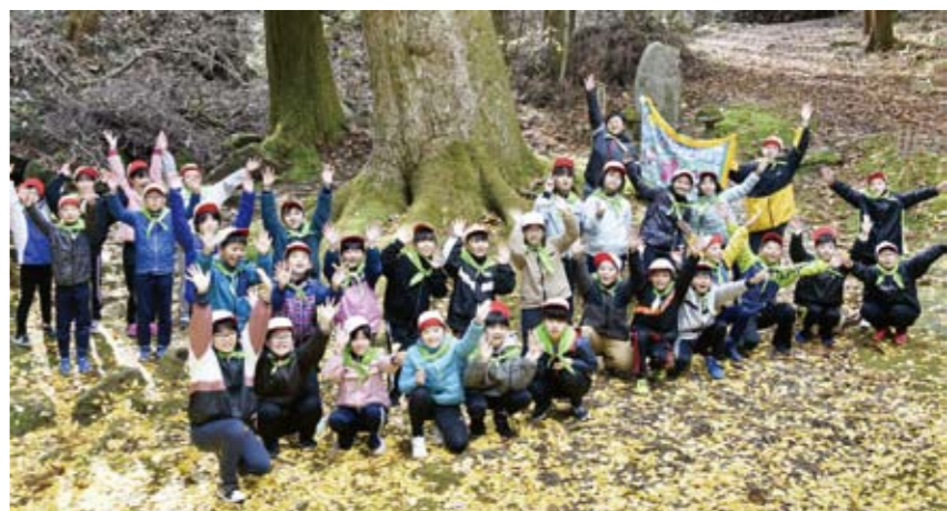
階上町の「緑の少年団」

樹木に近づくと、根元の土が踏み固められたり、根を傷つけてしまい枯れる原因となりますので、あまり近づかず、特に根は踏まないようにしてくだ