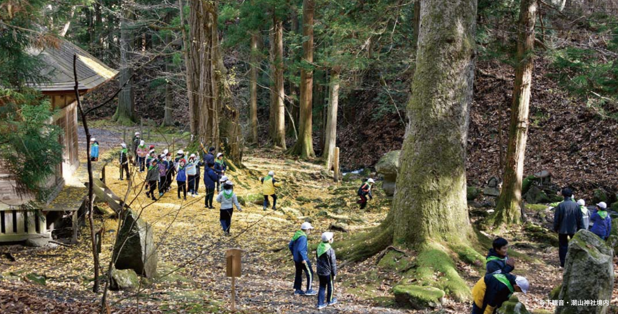
寺下観音・潮山神社境内

【本誌のデータについて】 ○このデータは、地上から1.3メートル部分の幹周を測定しました。 ○国内最大級とは日本全国で10位以内。青森県最大級とは、県内で10位以内を指します。 ○データは、平成22年度の環境省の全国巨樹・巨木データベースに登録済みの全国の巨木と対比した結果で記載しています。 ○樹のデータは、東北巨木調査研究会の平成23年・令和3年測定結果を表示しています。 ○巨樹・古木についての明確な定義はありませんが、このマップでは、これらの用語を次の定義で使用しています。 巨樹：環境省が、昭和63年度と平成11、12年度に実施した自然環境保全基礎調査における巨樹・巨木調査で使用した「地上1.3mの高さでの幹周りが3m以上」という基準を満たす樹木。 古木：樹齢がおおむね100年以上の樹木。 【本誌制作参考文献】 ○環境省巨樹・巨木データベース ○青森県の古木(青森県) ○青森県里山の巨樹・古木マップ ○郷土誌はしかみ60号(滝尻善英) ○ふるさとの古木(田名部清一) ○青森県の巨樹・古木(斎藤嘉次雄)