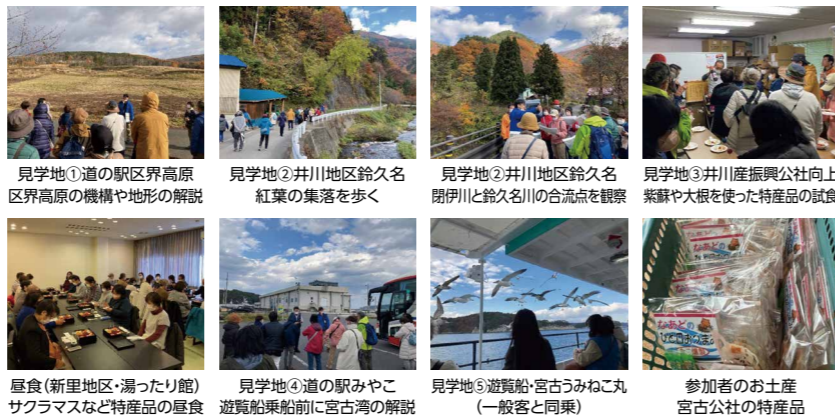
見学地①道の駅区界高原 区界高原の機構や地形の解説 見学地②井川地区鈴久名 紅葉の集落を歩く 見学地③井川地区鈴久名 閉伊川と鈴久名の合流点を観察 見学地③井川産振興公社 上 栗藪や大根を使った特産品の試食 見学地④道の駅みやこ サクラマスなど特産品の昼食 見学地⑤遊覧船「宮古みねこ丸」(一般客と同乗) 参加者のお土産 宮古の特産品