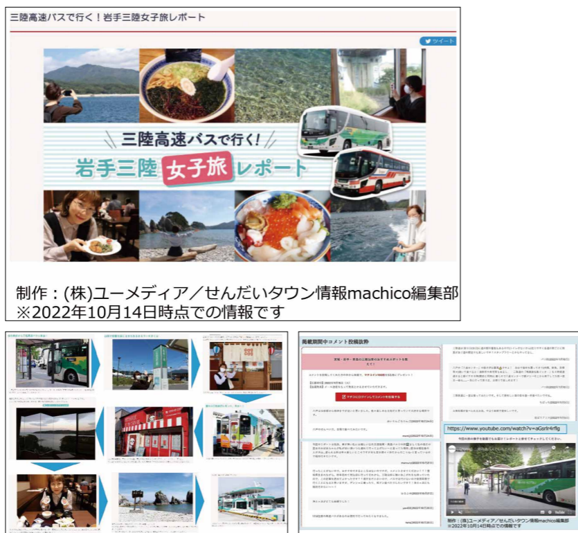
三陸高速バスで行く! 岩手三陸女子旅レポート 制作:(株)ユーメディア/せんだいタウン情報machico編集部 ※2022年10月14日時点での情報です