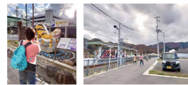
まち歩きMAPモニター検証の様子