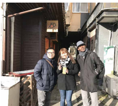
モニター調査の様子