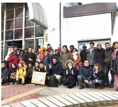
モニター調査員集合写真（JR石巻駅前にて）