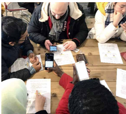
無料SIMカード操作の様子