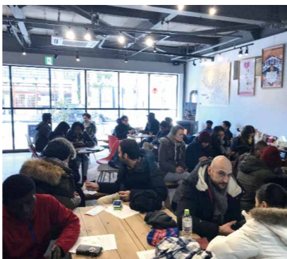
調査結果とりまとめの様子