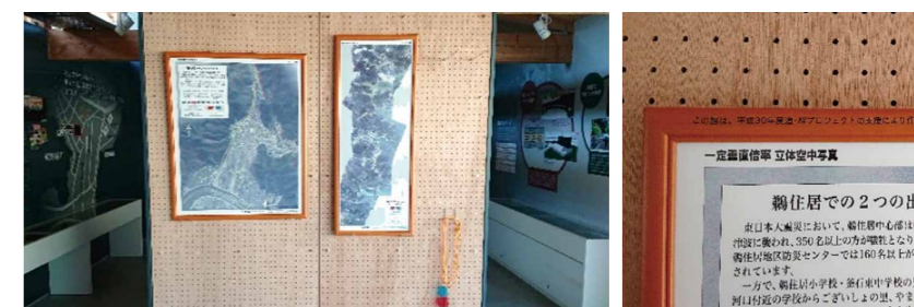
立体地形解析図パネル設置状況

<主たる実施団体> 釜石市総務企画部総合政策課震災検証室 株式会社かまいしDMC <協力> 釜石観光ボランティアガイド会・市内NPOなど