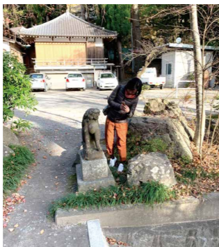
台湾の路上観察学会の方々ともち歩きをして、外国人視線での助言をいただいた。