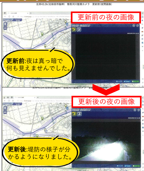
更新前の夜の画像