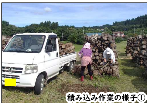
積み込み作業の様子①