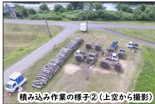
積み込み作業の様子②（上空から撮影）