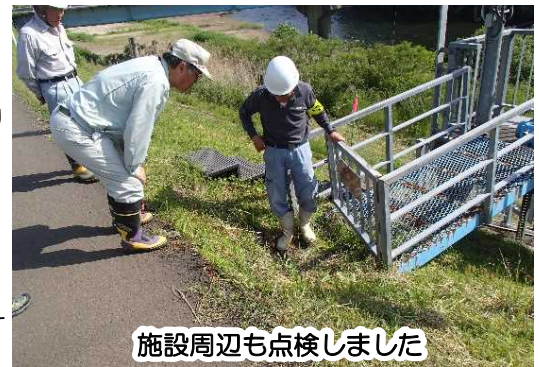
施設周辺も点検しました

不具合箇所については速やかに補修をしました。 その他、軽微な補修が必要な箇所については引き続き補修・対応し出水に備えてまいります。