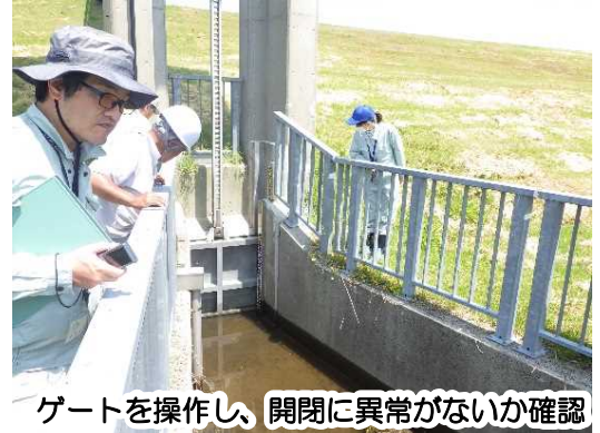
ゲート进行操作し、開閉に異常がないか確認

樋門樋管等の点検は毎月各施設の観測員が行っていますが、年に1度事務所、出張所職員も加わり、ゲートの動作確認、施設やその周辺の異常や損傷がないか等を一緒に確認しているものです。