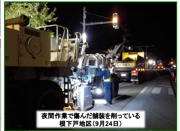
夜間作業で傷んだ舗装を削っている 根下戸地区(9月24日)