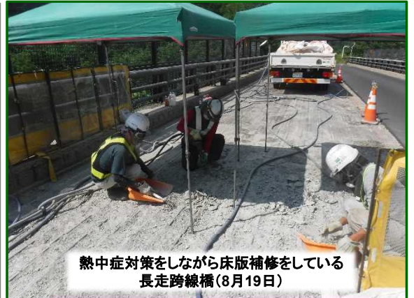
熱中症対策をしながら床版補修をしている 長走跨線橋(8月19日)

※「床版」とは・・・橋のアスファルト下のコンクリート部分のこと。床版補修では、古くなったコンクリートをはがして新しいコンクリートを施工します。