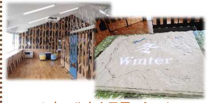
▲ウエルカムステーション