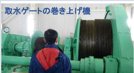
取水ゲートの巻き上げ機