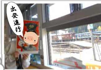
▲トレインビューカウンター