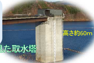
外から見た取水塔

取水塔とは…ダムに貯めた水を取り込むための施設で、その水は発電などに利用されています。 今回見学した取水塔内をご紹介します！